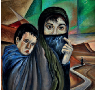
Hagar