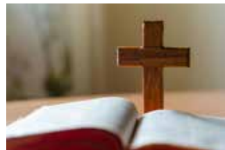
N. Schwarz © GemeindebriefDruckerei